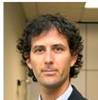
L'advocat a l'empresa